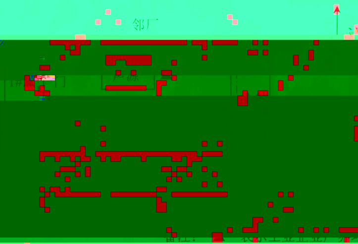
图 1：工业企业厂界环境噪声检测点位示意图